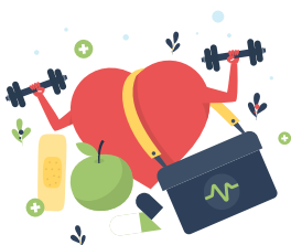
Conseils en santé