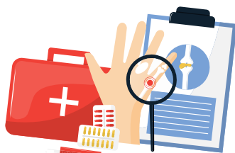
Accès aux soins

Retrouvez l'équipe de professionnels de santé lors de leurs permanences, sur tout le territoire Nord Charente-Maritime.